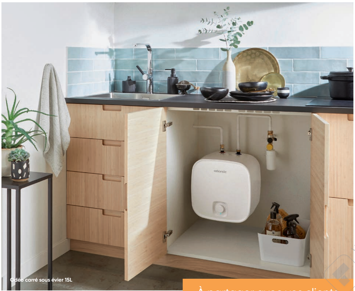
Odéo carré sous évier 15L