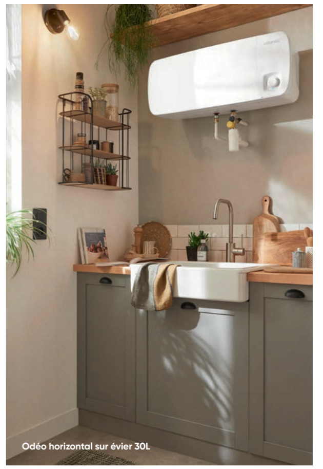
Odéo horizontal sur évier 30L