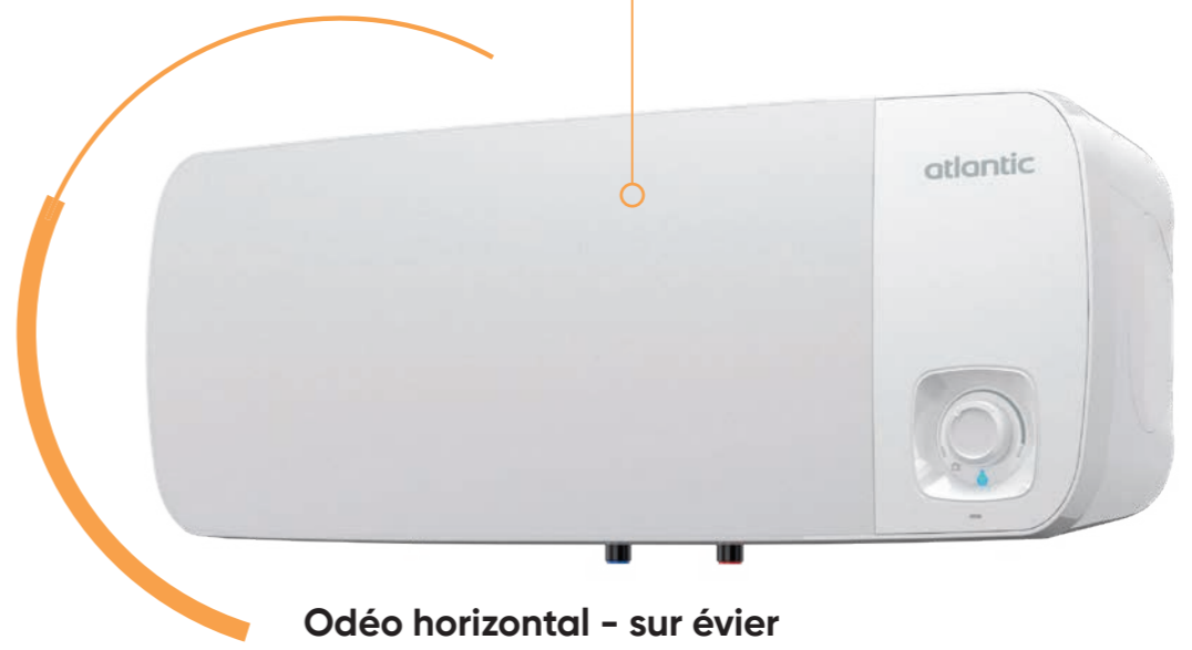
Odéo horizontal - sur évier

+ de facilité de pose Rail de guidage pour fixation au mur