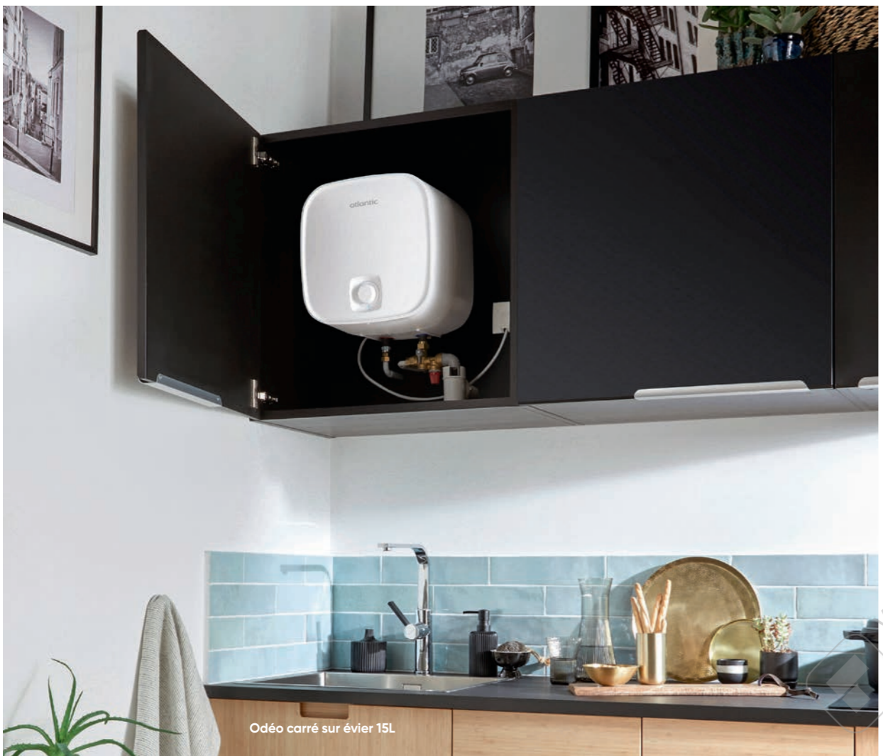
Odéo carré sur évier 15L